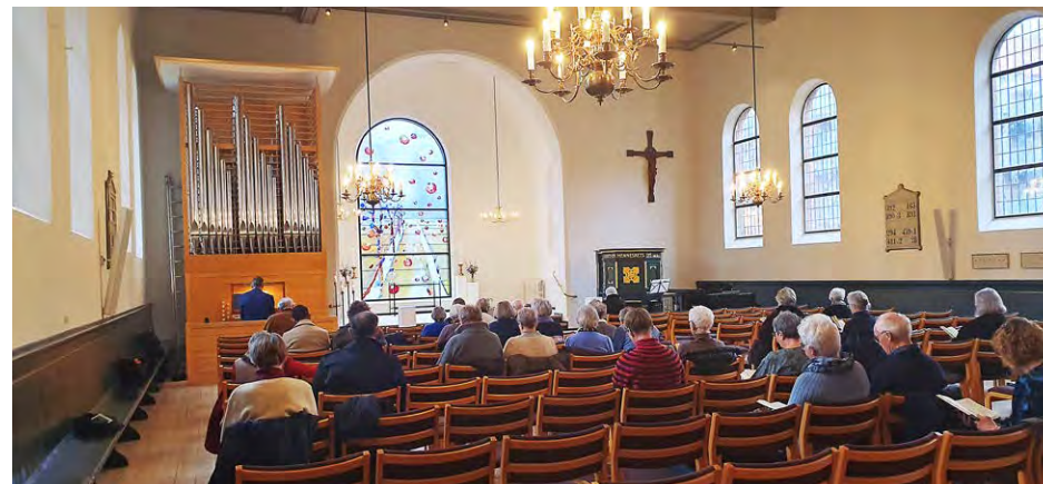
Billede fra en gudstjeneste

I år var 60 personer mødt op, og vi har fået rigtig gode tilbagemeldinger. Endvidere har vi i den forbindelse drøftet, om der er stemning for, at vi i bestyrelsen afholder et møde for bestyrelsesmedlemmer - nye og/eller gamle - for