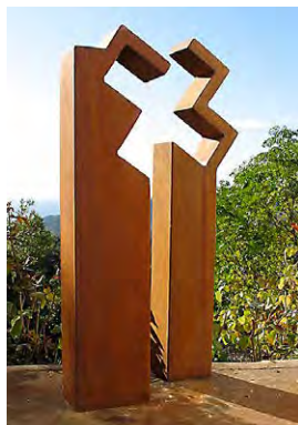
Open Cross udført af Pierre Oliver

Marmorfrisen fra 1931 bærer navnene på Odense Valgmenigheds præster gennem tiden, disse har hver især i deres tid bidraget til kirkens liv. Menighedens