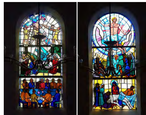
De 2 glasmosaikker i koret som er udført af Johan Thomas Skovgaard (1963)