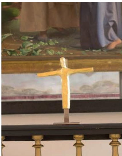
Krucifiks ved Ansgarkirkens alter